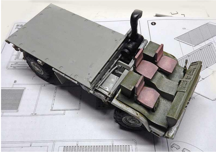
Détail de la cabine. Pas de difficultés majeures...