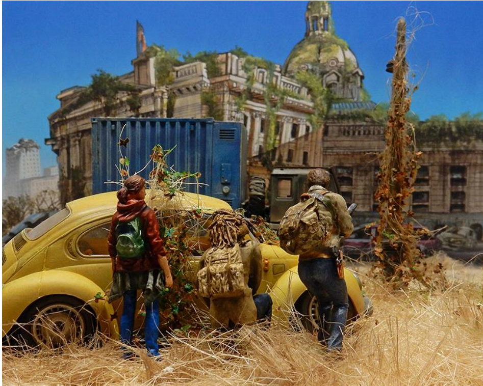
Le diorama est terminé... The diorama is complete...