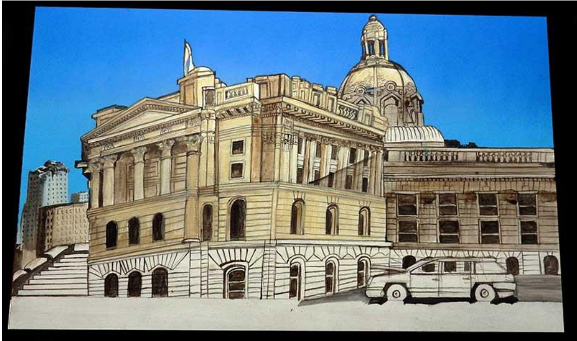
Premières esquisse du bâtiment en Terre d'ombre...